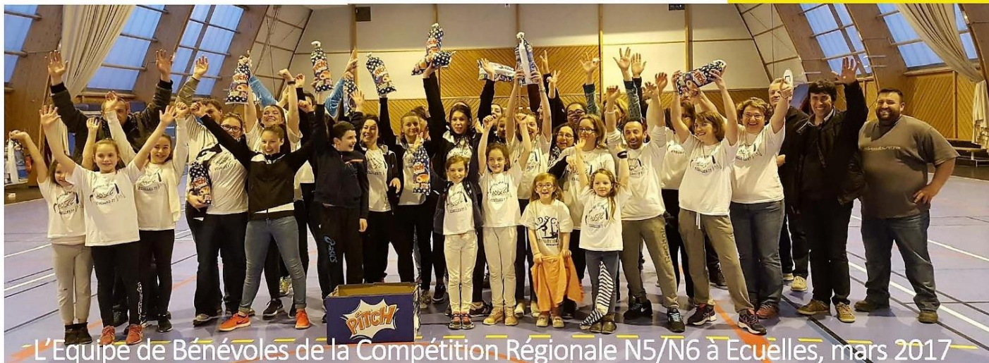
L'Equipe de Bénévoles de la Compétition Régionale N5/N6 à Ecuelles, mars 2017